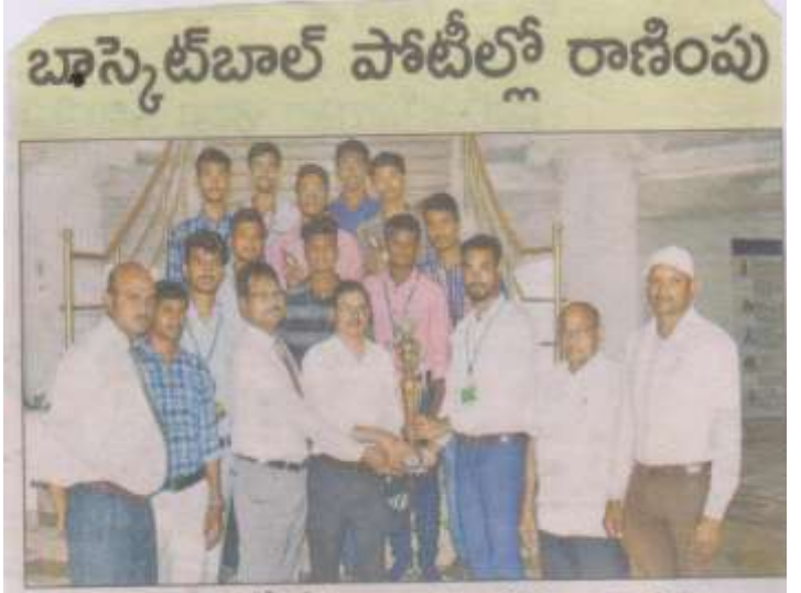
సాధించిన ట్రోఫీతో కణాశాల యాజమాన్యం, విద్యారులు

దలోని ధనేశుల ఇంజిసీరింగ్ కళాశా సోమవారం ఓ ప్రవటనలో తెలిపారు පත් ඈ බහ 15, 18 මිසින් සිබුවින් පතිබ, පතිම මර්ගා වෙන් විස්වේ యూకే జోన్ స్త్రీ ఇంటర్ కాలేజియట్ డైరెక్టర్లు డ్యార్ ఎన్ఏ రాజీవమార్ బోర్బమెంటిలో మైలవరం లకిరెడ్డి ఎస్.దుర్గారెడ్డి. ఎం.పథ్యమగుజలన బాలిండి జంజినీరింగ్ కళాశాల విద్యా కళాశాల (జనీజెంట్ జి.శ్రీనివాసరెడ్డి ర్మలు బాష్కెట్ జాల్ పోటిల్ వైస్ వైద్యన్ ఆకరెడ్ ప్రసాద్ కెడి. తది దింతీయ స్పోసం పాధించినట్ల ఆ కళా తరులు ఆధినందించారు.